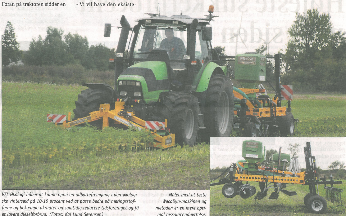
VFL Økologi håber at kunne opnå en udbyttefremgang i den økologiske vintersæd på 10-15 procent ved at passe bedre på næringsstofferne og bekæmpe ukrudtet og samtidig reducere tidsforbruget og få et lavere dieselforbrug.

kl@effektivtlandbrug.dk telefon 61 20 96 67